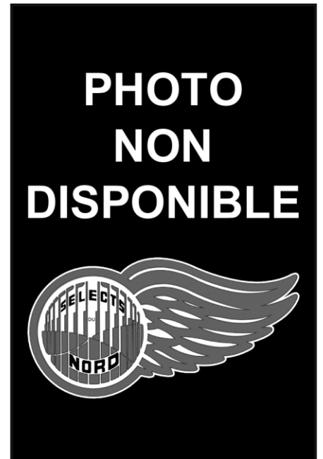
BENOIT BOHÉMIER Entraîneur-adjoint